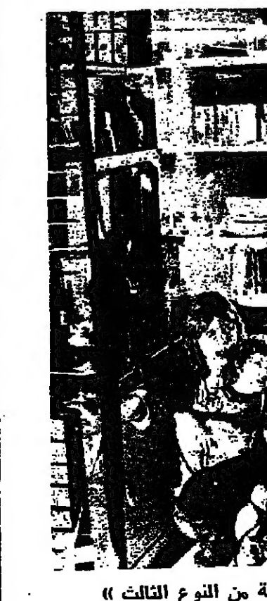
لقطة من « لقاءات » قريبة من النوع الثالث